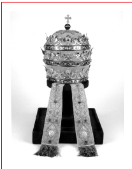
La Tiara (en la foto, tiara de Pío IX) es el símbolo de la plenitud del poder papal

formaliter (es lo que sucede cuando muere un Papa, en particular si el Cónclave debidamente convocado debe ser diferido por causas extrínsecas). Si el “papa” persiste en su error, está ipso facto fuera de la Iglesia y no es entonces más papa en absoluto, ni siquiera materialiter . Si el “papa” abjura de su error, toca al Cónclave “decidir” la alternativa: o bien este “papa” arrepentido se vuelve Papa formaliter ; o bien , de acuerdo a la bula de Pablo IV, este “papa” ha perdido por herejía la aptitud para volverse Papa formaliter que le había conferido, ante la Iglesia , el hecho de estar regularmente elegido por un Cónclave válido. Nunca la Iglesia juzga al Papa. Pero toca a la Iglesia (Cónclave convocado por M) decidir si, sí o no , hay “reviviscencia canónica”, en el “papa” arrepentido, de la aptitud eclesial para ser Papa. De esta manera, la Iglesia no juzga en el “papa” sino lo que en él sale formalmente de la Iglesia.