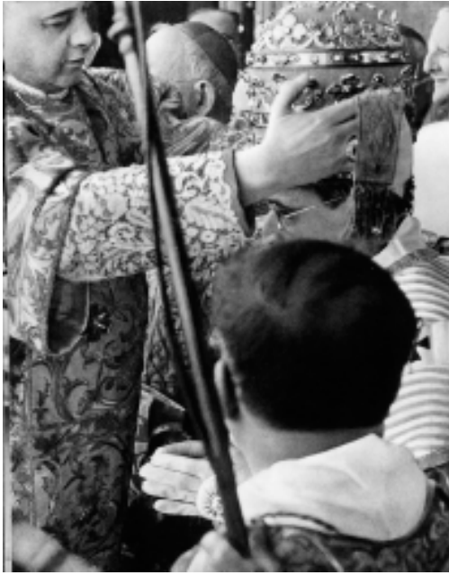
La coronación de Pío XII

que, en el mismo momento en que el Cardenal Pacelli afirma exteriormente aceptar la elección, no ponga interior y ocultamente un obex que le impida recibir la Comunicación prometida y ejercida por Cristo. Si se verificara ulteriormente que existía un tal obex en el acto de aceptación, el Cardenal Pacelli no sería en ningún momento Papa formaliter .