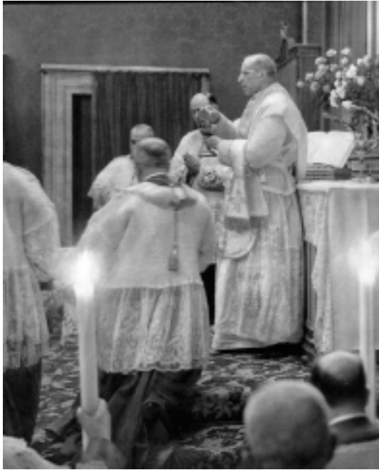
El Papa Pío XII celebrando la Santa Misa

Siendo así, hay que concluir que la Misa “ una cum ” está “ ex se ” objetivamente manchada de sacrilegio. En efecto, la Misa es la acción sagrada por excelencia, ya que el Sacerdote obra “ in Persona Christi ”. Y si esta función instrumental concierne eminentemente al acto consecratorio, se realiza igualmente por derivación durante lo que precede y prepara el acto, o se desprende de este inmediatamente. Ahora bien, todo lo que pertenece a la acción sagrada debe ser puro; es decir, conforme a lo que exige su naturaleza. Una proclamación que especifica inmediatamente el ejercicio concreto de la Fe, debe ser siempre verdadera con respecto a la Fe misma. Debe serlo, en segundo título , si es hecha durante una acción sagrada. Si entonces una proclamación que especifica inmediatamente el ejercicio concreto de la Fe y es hecha durante una acción sagrada, es errónea, constituye ipso facto y objetivamente un delito , no solo contra la Fe sino igualmente contra la acción sagrada. Una tal proclamación está entonces inculpada (afectada) de un delito del género “sacrilegio”; y eso, objetiva e ineluctablemente , sea lo que sea del pecado cometido por los participantes (cf. 6).