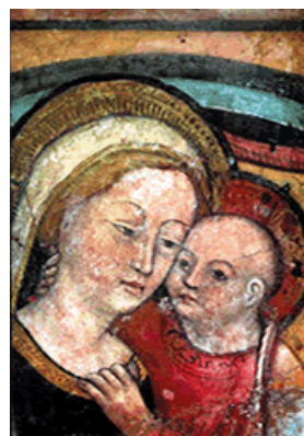
Mater Boni Consilii

1) Conviene a este propósito responder a una objeción alegada por Mons. Lefebvre y sus seguidores. Pretenden que “ rehusar mencionar a W en el Te Igitur ” es -dicen- “ rehusar rezar por el Papa ”. Nada de eso es verdad. Conviene, por el contrario, eminentemente rezar por W como persona privada, rezar por él y por su conversión, en el Memento de los vivos. Mientras que es evidentemente imposible rezar por una persona en cuanto asumiría en acto la fun-