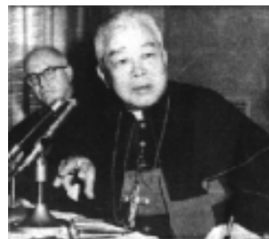
Mons. Ngo-Dinh-Thuc en 1962

“ Ex parte subjecti ”, id est : Joseph Ratzinger et auctoritatis ”. Los únicos actos de la “autoridad”