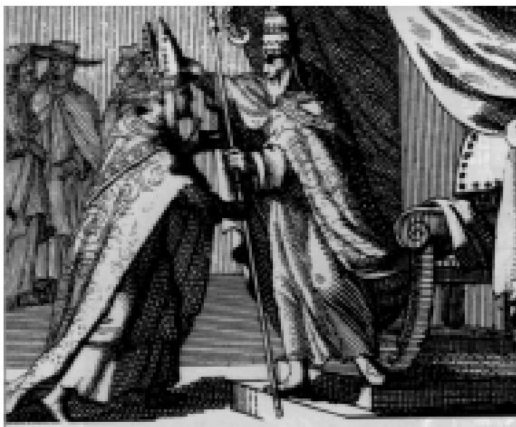
Pío V nombra obispo a Felice Peretti.

a la elección del general y les confió el cargo de penitenciarios de San Juan de Letrán. Uno de los personajes que más disfrutó de la confianza y afecto de Ghislieri fue el franciscano Felice Peretti, futuro Sixto V, a quien primero nombró Inquisidor y luego, tras favorecer su elección como general de los franciscanos, nombró obispo y más tarde cardenal, responsable de tres congregaciones (de los obispos, del Concilio y del Índice) (24).