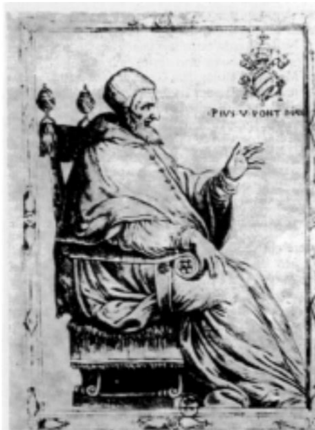
San Pío V en un grabado del siglo XVI.

héroe de la Cristiandad. Con la excepción de Celestino V, San Pío V fue el primer Papa santo después de San Gregorio VII. Se puede decir que Ghislieri había seguido a Hildebrando desde Soana en todo... en la tierra como en el Paraíso y en la gloria que debía ser entregada a ambos en la tierra por la Iglesia Católica.